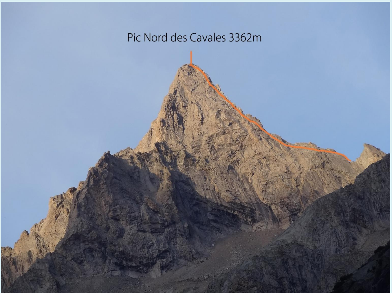
Pic Nord des Cavales 3362m

L'itinéraire de la voie normale de la Grande Ruine